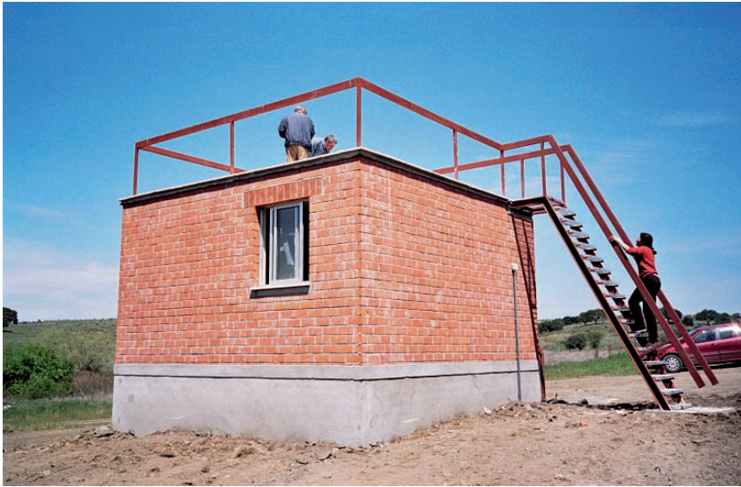
Fotografía 1: Fotografía del módulo terminado.