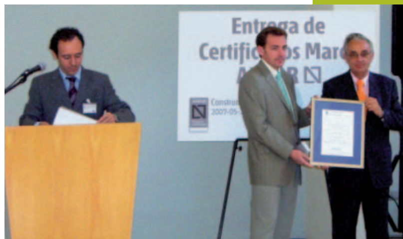
Momento de la entrega del certificado a uno de los Licenciatarios de la Marca AENOR