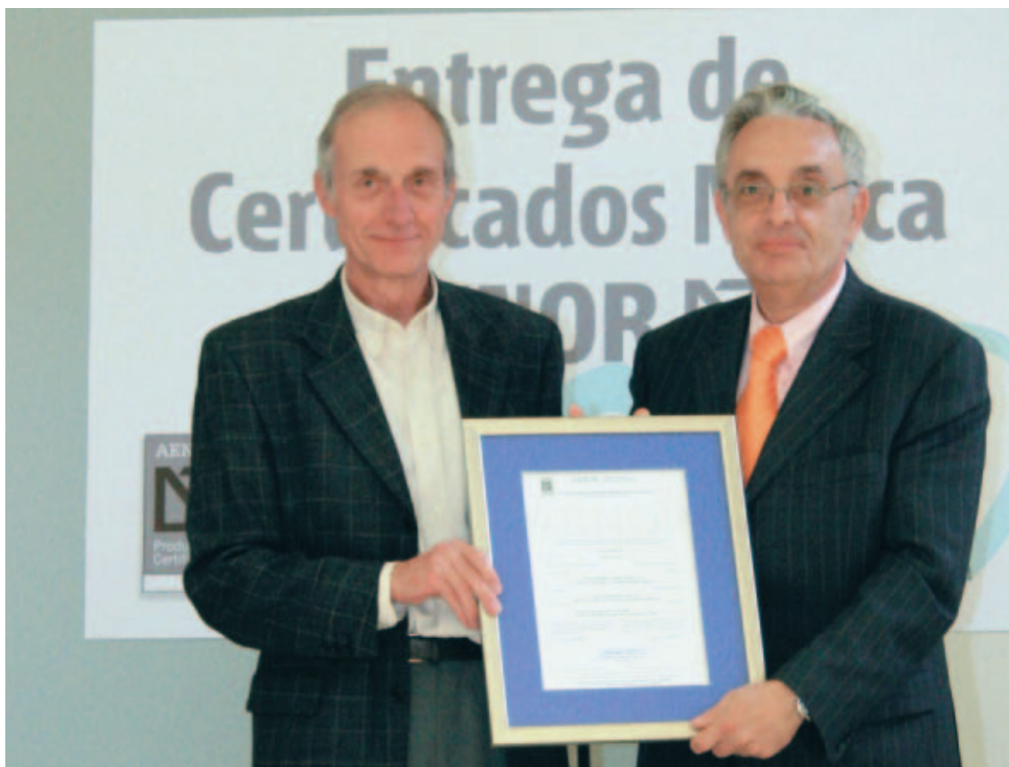
El momento de la entrega del certificado a uno de los Licenciarios de la Marca AENOR

A.C. URGELL, S.L. ACABADOS Y MONTAJES INDUSTRIALES, S.L. AICONSA POLIURETANOS, S.L. AILLAMENTS J. L. VILAS, S.L. AILLAMENTS MARTINEZ-AMOROS, S.L. AILLAMENTS PLASFI, S.L. AILLAMENTS SEGARRA, S.L. AIPOL, S.A. AISFORMA POLIURETANOS, S.L. AISLABIN, S.L. AISLAMIENTOS AZKORRA, S.L. AISLAMIENTOS BALLARÍN, S.L. AISLAMIENTOS DE LLEIDA JYJ MAYORAL, S.L. AISLAMIENTOS HERLEN'S, S.L. AISLAMIENTOS RAMBLA, S.L.