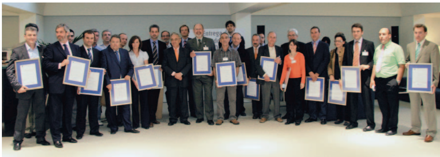
Foto de Familia una vez entregado los Certificados

LA ENTREGA DE ESTOS CERTIFICADOS, que sustituyen y anulan a los anteriores, se entregaron el pasado 16 de mayo, con motivo de la Acreditación por ENAC el 21 de febrero de 2007 al AEN/CTC-020, Comité de AENOR para la Certificación de Materiales Aslantes Térmicos cuya Secretaría desempeña ANDIMA.